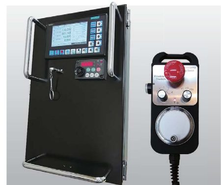
新型メインコントローラ & 手動パルスコントローラ USBメモリで加工データを取り込みます。